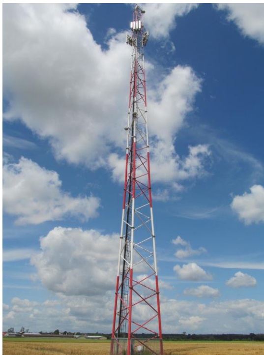
Zaf. nr 1: Widok ogólny instalacji radiokomunikacyjnej.