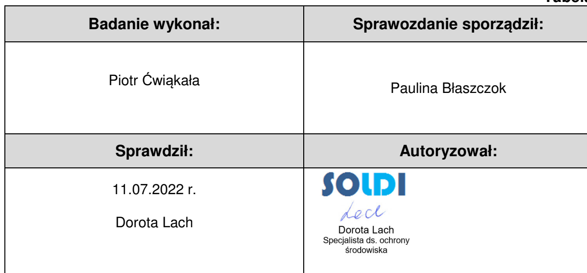
Tabela nr 6

Stwierdzenia zgodności dokonano na podstawie zasady podejmowania decyzji i wymagań zawartych w załączniku do Rozporządzenia Ministra Klimatu z dnia 17 lutego 2020 r. w sprawie sposobów sprawdzania dotrzymania dopuszczalnych poziomów pól elektromagnetycznych w środowisku [Dz. U. 2020, poz. 258, Dz. U. 2022, poz. 1121].